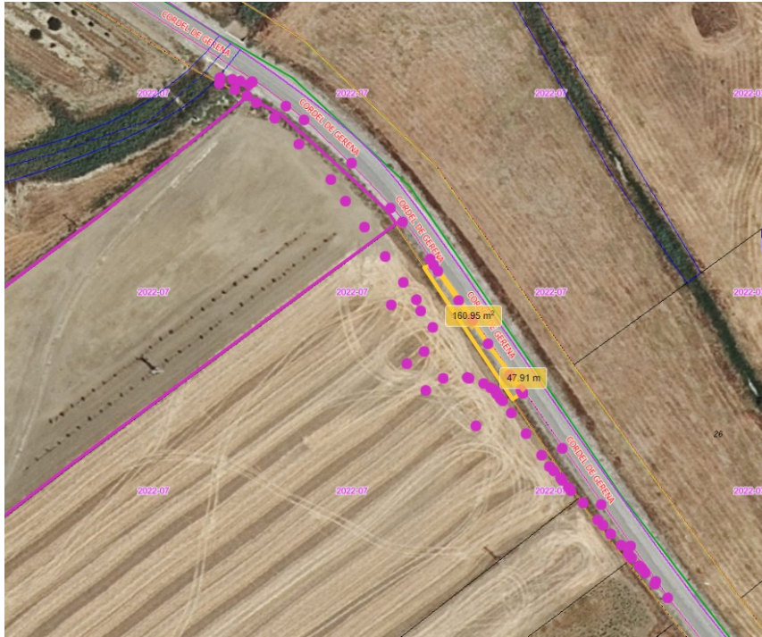
Imagen 1: coordenadas presentadas en la propuesta de aseguramiento.